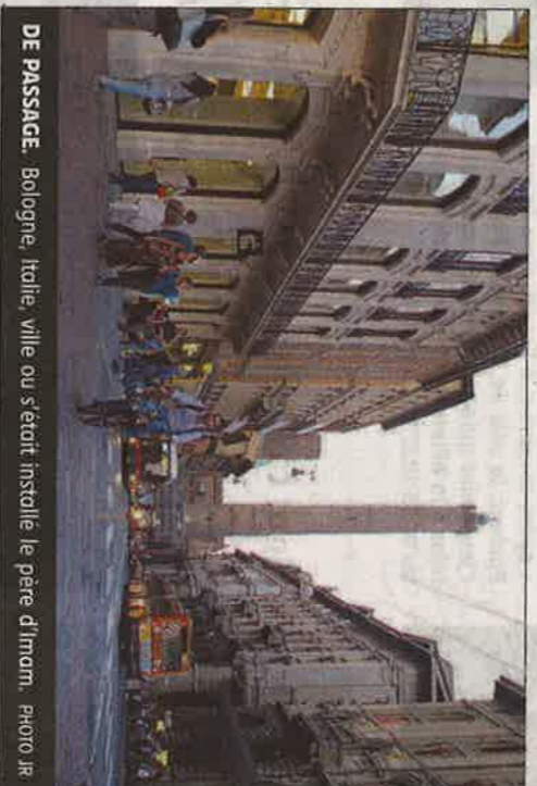
DE PASSAGE. Bologne, Italie, ville où s'était installée le père d'Iman.

» Il s'installe pendant tout un mois en Tunisie, puis décide de continuer son aventure. Arrivé en Libye, il décide de s'arrêter pendant un peu plus d'un mois pour réfléchir sur ce que serait